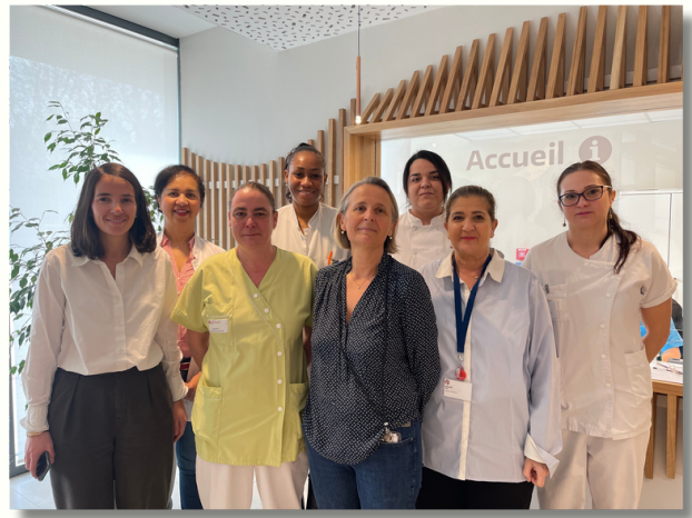
L'équipe de SaintJoseph-Montval