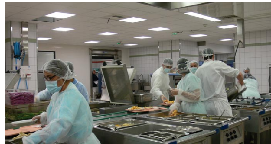
La préparation à la chaîne des plateaux des malades

La conception du nouveau restaurant du personnel a pris en compte tous les points identifiés comme "faibles" : le bruit est atténué, la luminosité est idéale, le plafond est désormais clair et coloré, la salle est parsemée de blocs absorbant les bruits.