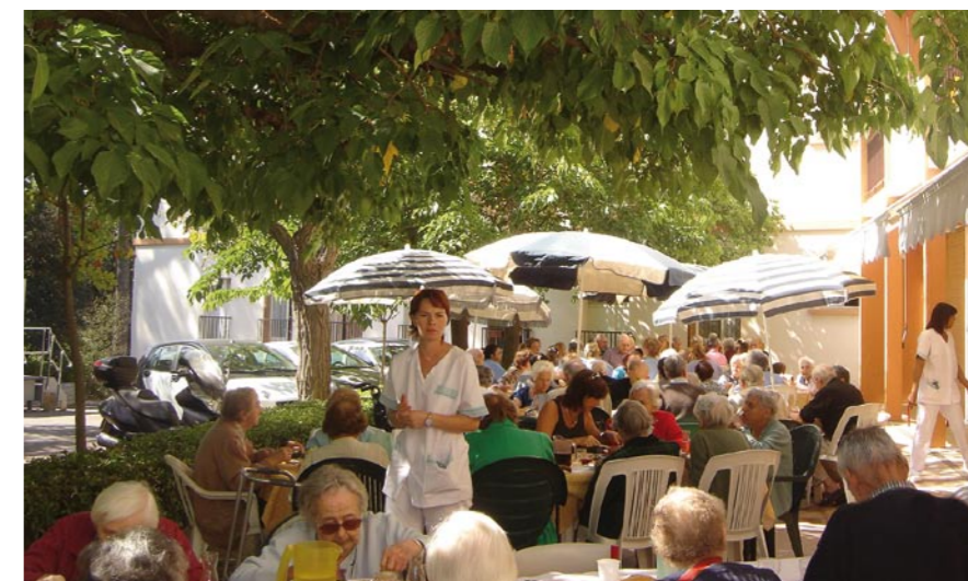
Une animation à La Salette Montval.