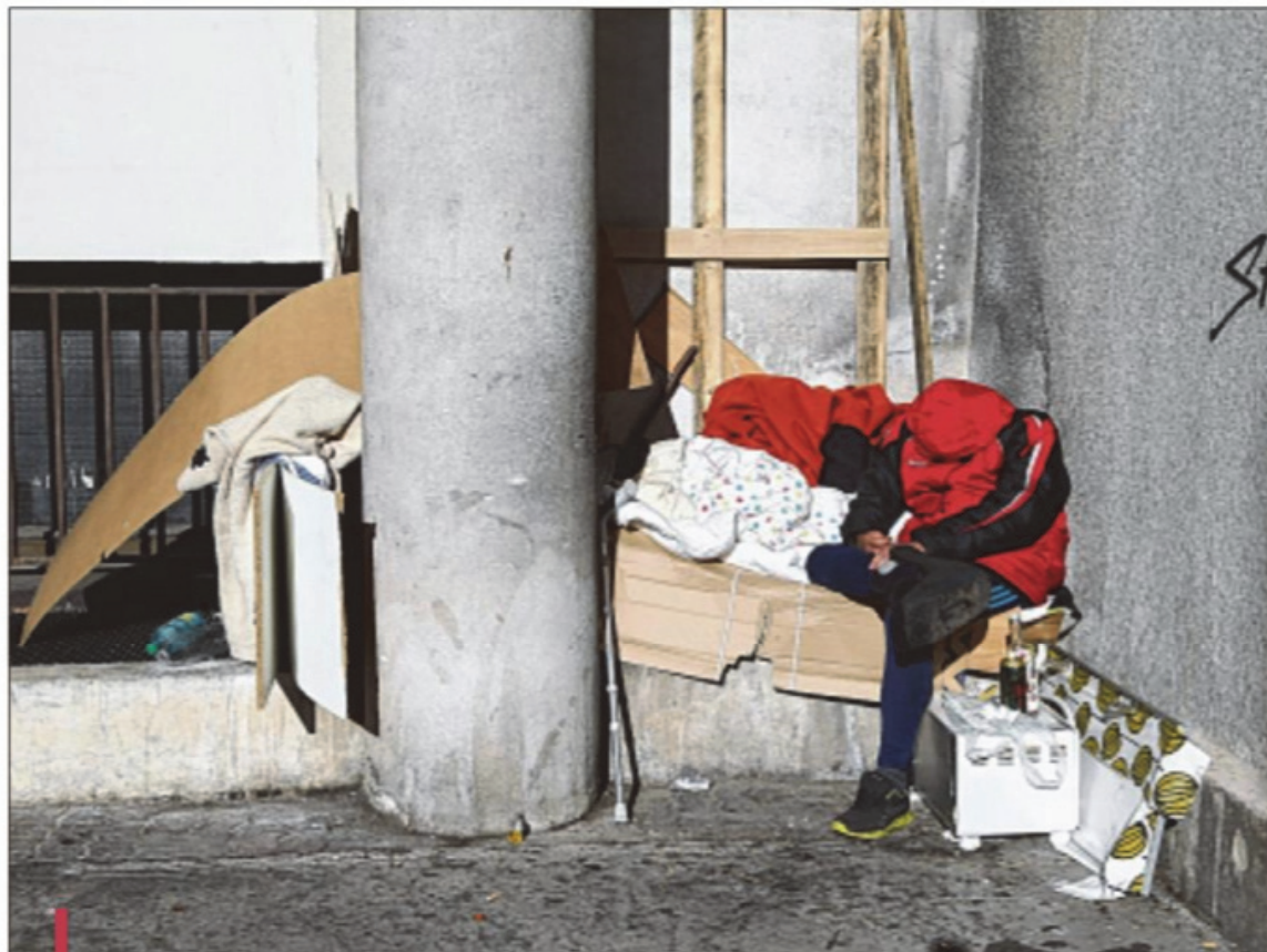
Une étude révèle que 9 SDF sur 10 ne reçoivent pas le traitement adapté à leurs troubles.

Or, les résultats sont accablants: "9 sur 10 ne reçoivent pas un traitement adapté" ont constaté les auteurs. "Plus de la moitié ne recevaient pas un traitement de fond approprié" (des antipsychotiques pour la schizophrénie ou un régulateur d'humeur pour le trouble bipolaire), 48% souffraient de plus d'une "dépression non traitée". Facteur aggravant, 46% recevaient des anxiolytiques sur de longues périodes, et 15% des hypnotiques, "ce