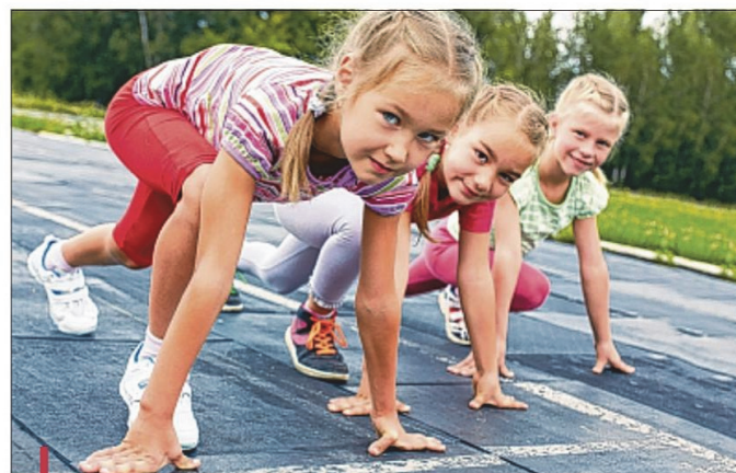
Filles et garçons partagent souvent le même terrain lors des différents tournois de jeunes. Preuve que le sport est ouvert à tous, peu importe l'âge ou le sexe.

Pour un enfant, la pratique d'un sport en dehors des heures de cours constitue une véritable bulle d'oxygène. "Chaque activité sportive apporte de manière différente à l'enfant un bénéfice à la fois physique mais aussi psychologique. Ce double apport doit rentrer en compte dans le choix du sport en fonction de ce que l'on cherche à apporter à son enfant", détaille le spécialiste. Cependant, tout le monde ne peut pas pratiquer le sport qu'il souhaite. Il existe des impondérables auxquels les familles sont confrontées. Lorsqu'il y a