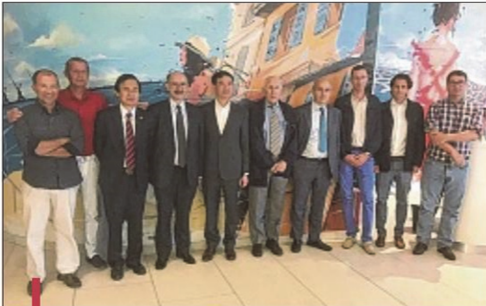
Les médecins français et vietnamiens étaient réunis hier soir à Marseille grâce à l'association Vietnam au cœur.