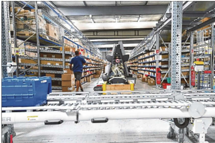
Le centre de répartition. Au cœur, son automate traite 40% des commandes

Le logisticien de la santé s'est doté d'un nouveau centre à Marseille. Il livre 460 pharmacies dans notre région