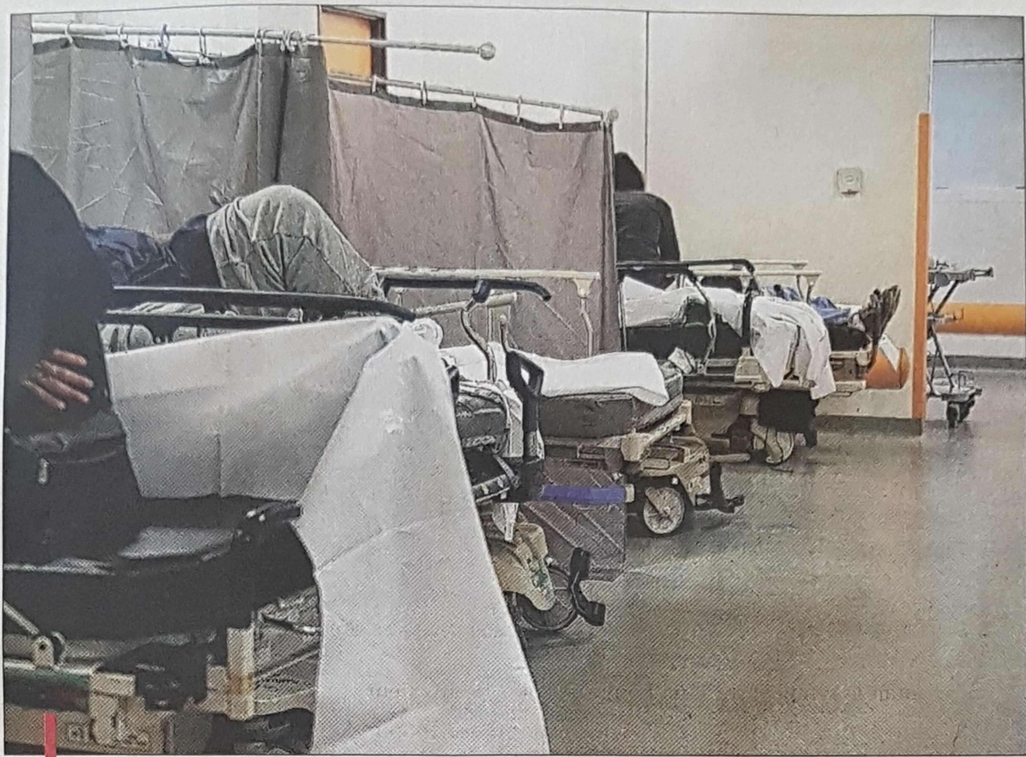
Aux urgences Timone, la fréquentation a augmenté de 20% ces jours-ci. Au moment même où plusieurs boxes et chambres ont dû être fermés pour cause de punaises de lit... /PHOTO ILLUSTRATION

Autant dire que les services hospitaliers déjà "en tension" (la