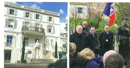
À gauche, la maison de retraite de La Salette-Montval. À droite, inauguration, en décembre 2011 à Auriol, de la statue de l'Abbé, fondateur de la Musique des Amis réunis et du cercle Saint-Pierre.

L'Association Fouque (anciennement Jean-Baptiste Fouque pour l'Aide à l'Enfance ) regroupe de nombreux établissements qui prennent en charge des enfants ayant des difficultés sociales ou présentant des troubles de caractère et de comportement. Ce sont notamment des Maisons d'enfants à caractère social : Les Saints-Anges , le Centre Jean-Baptiste Fouque , le Foyer Concorde et le Centre de