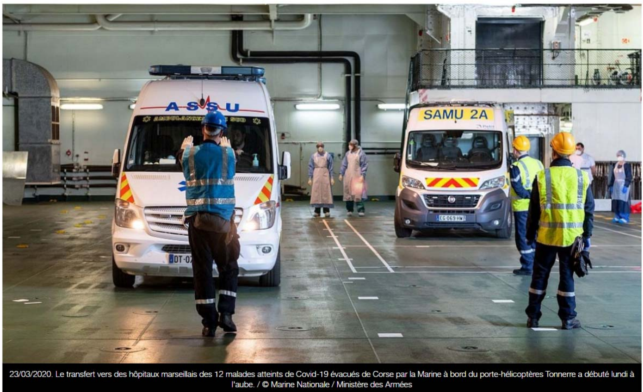
23/03/2020. Le transfert vers des hôpitaux marseillais des 12 malades atteints de Covid-19 évacués de Corse par la Marine à bord du porte-hélicoptères Tonnerre a débuté lundi à l'aube.

Par Grégoire Bézie, Ludovic Moreau avec AFP Publié le 23/03/2020